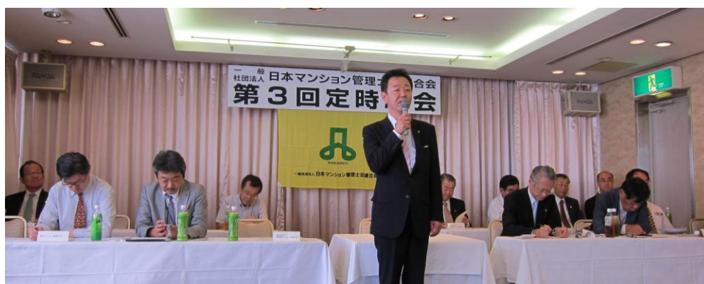
写真は挨拶する親泊会長

総会終了後懇親会があり、政界から多数の方及び、国土交通省はじめマンション管理センターからも多数 参会されました。なごやかな雰囲気懇親を深めることができましたと思います。