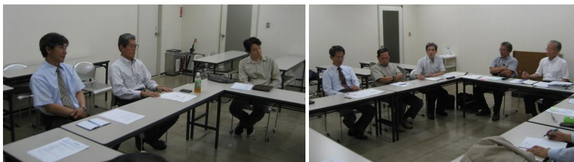
写真は交流会の様子